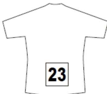
トラックタイム系種目